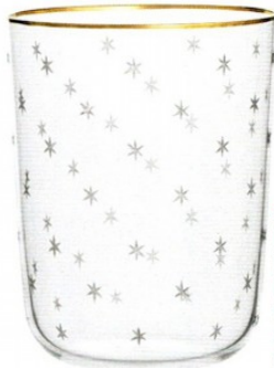
Sternenglas Lobmeyr Glas liefert das passende Design zur umfassenden Renovierung der Wiener Synagoge.

„Kornhäusel war ein wichtiger Architekt für die frühe Moderne, und diese Serie von 1856 war ebenfalls extrem